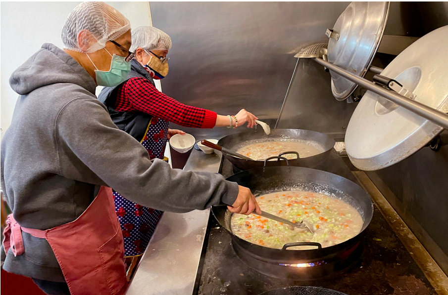
典座佛學班的學員們精心烹調臘八粥。