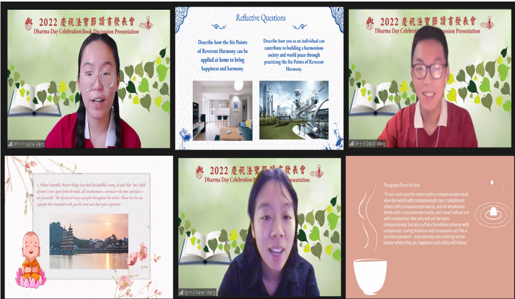
佛光青年以青年的思維與熱情，展現信仰傳承的未來與希望

第一分會以「四經中四不一之體悟為發表，週邊平分享不變應緣，隨緣不變的生活。恰過，山高豈礙白雲信仰和清淨心。