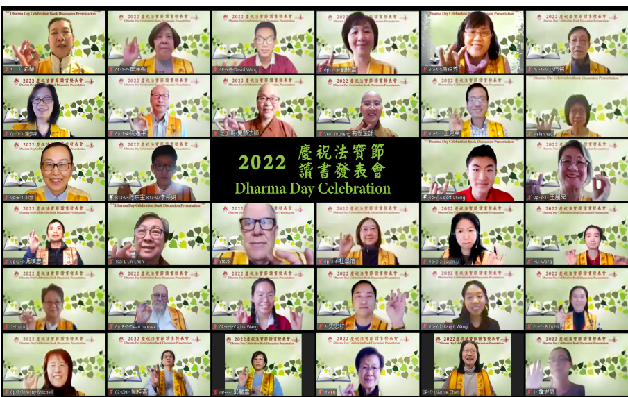
芝加哥佛光協會舉辦慶祝法寶節讀書發表會，分享學習佛法的感知與體證