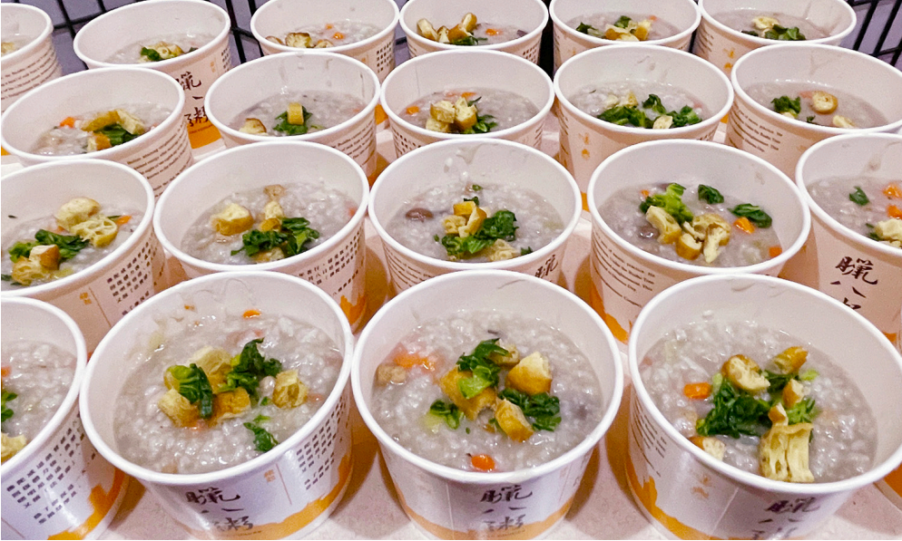
為慶祝農曆十二月初八釋迦牟尼佛成道日，以臘八粥，供養大眾，廣結善緣