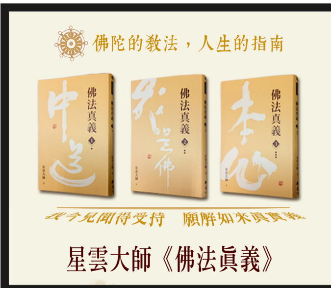
第一分會以星雲大師著《佛法真義》分享心得體會