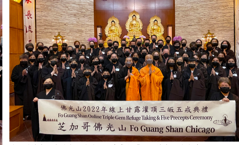
芝加哥佛光山與總本山連線，同步舉行「2022佛光山甘露灌頂三皈五戒典禮」。