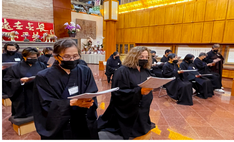
芝加哥有超過半數的五戒戒子為本土英文人士。