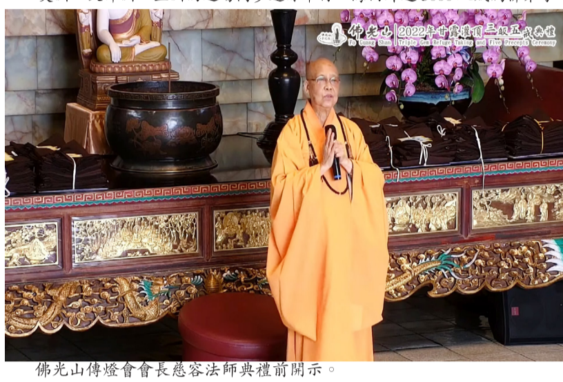
佛光山傳燈會會長慈容法師典禮前開示。