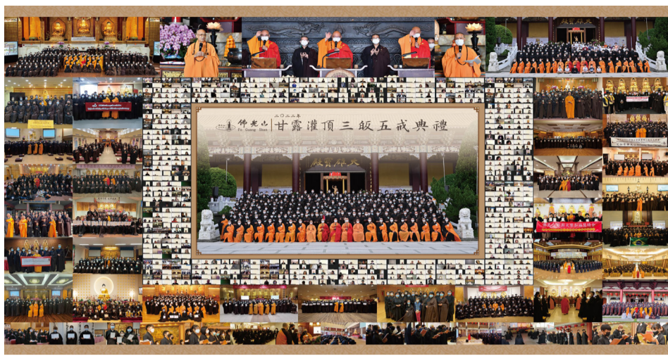
「佛光山2022年甘露灌頂三皈五戒典禮」，佛光山總本山與海外北美洲、南美洲、大洋洲、亞洲的道場同步連線舉行，海內外逾3000人成為佛弟子。