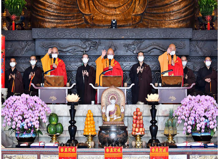
典禮現場於佛光大雄寶殿。