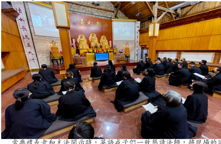
當典禮長老和主法開示時，英語戒子們一致懇請法師，將現場的同聲傳譯，變為即時翻譯英文字幕的方式，大大減輕了英文人士同時聽中英文的干擾。