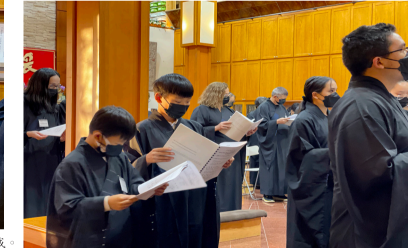
佛光家庭的第二代、第三代的青年與幼童受持五戒。