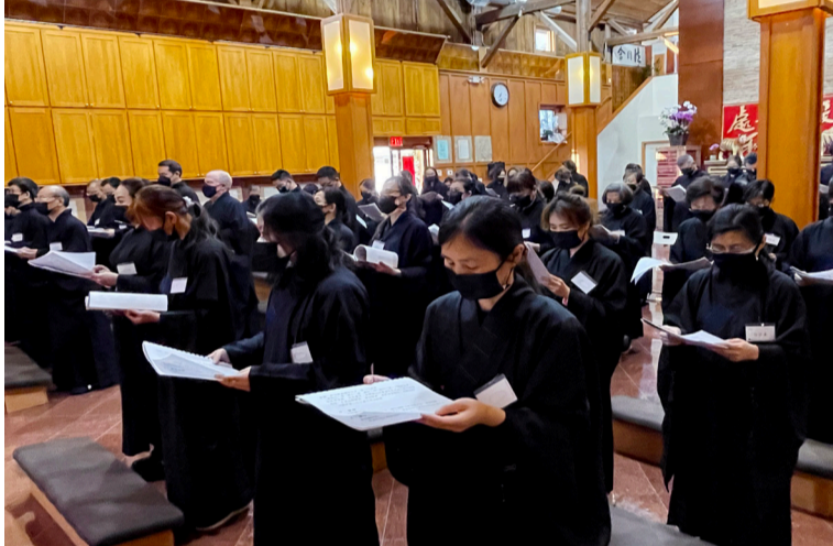
60名芝加哥佛光人把握難逢難遇的機會三皈五戒。