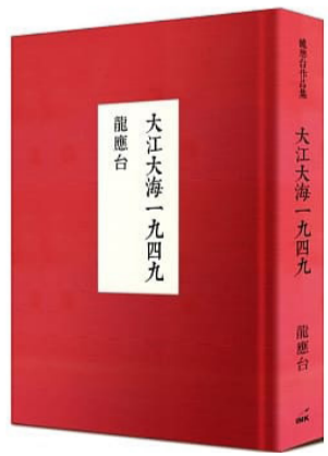
龍應台大江大海一九四九