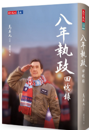
馬英九總統親筆簽名書