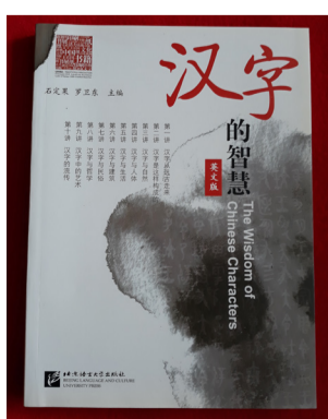
漢字的智慧 (简体字版,中英对照)