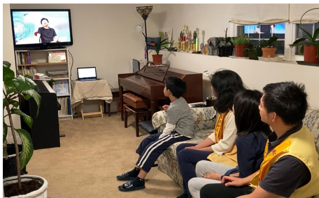
客廳即教室 線上聆聽佛法與藝術之美