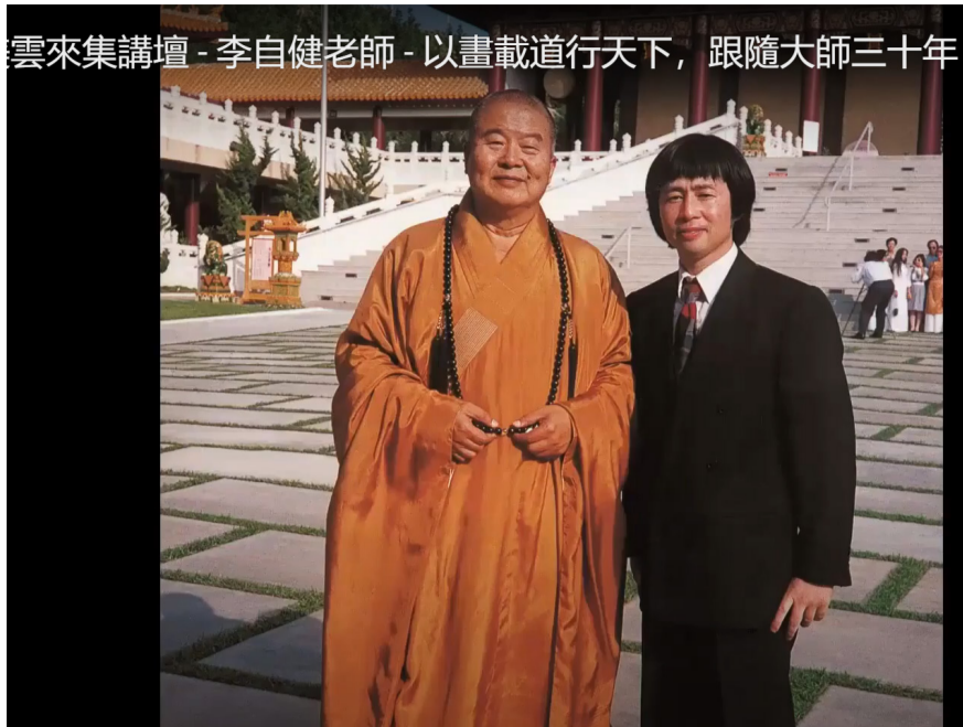
星雲大師與李自健攝於洛杉磯