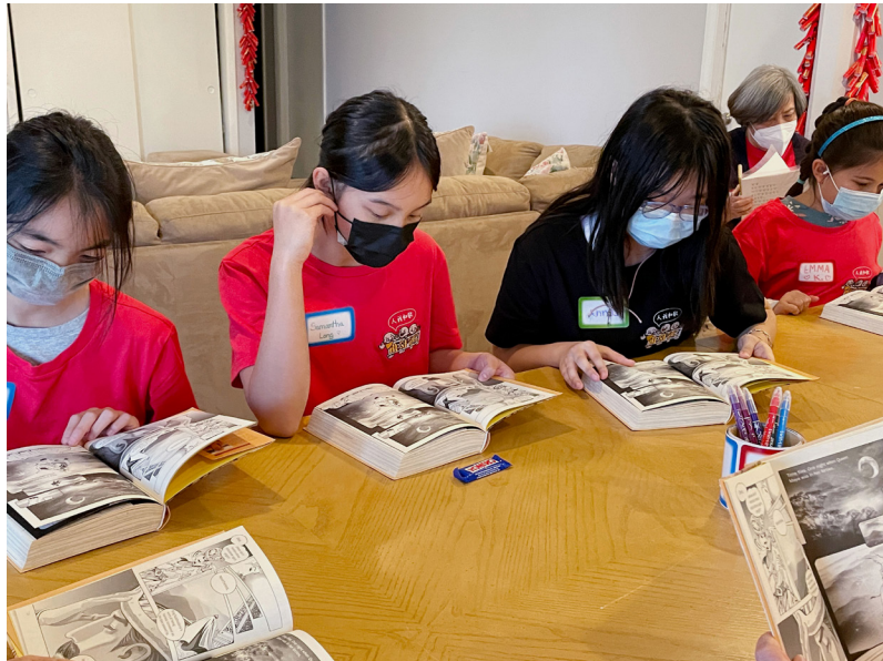
小菩薩們非常喜歡閱讀《佛陀的故事》，在學習的過程中感受到樂趣。