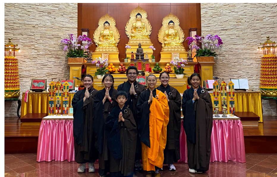
青少年法器班成立已三年之久，第一批學員承擔各大法會的法器與唱誦。