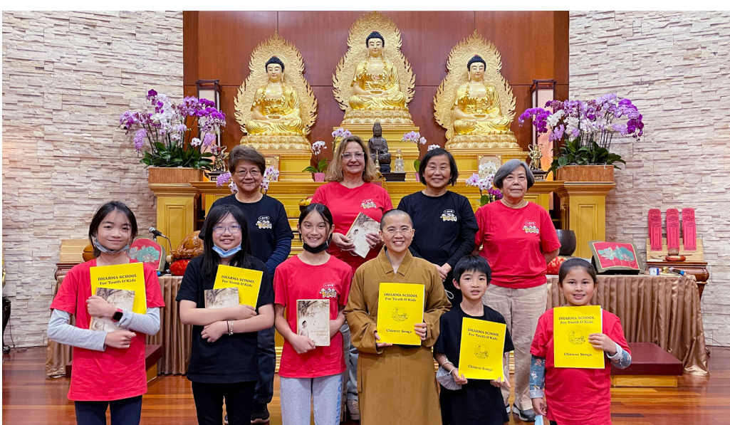
11月6日芝加哥佛光山「青少年及兒童佛學班」開學啦！