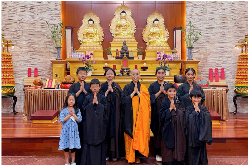
青少年法器班愈發壯大，目前有15位佛光第二、三代仍在分批學習中