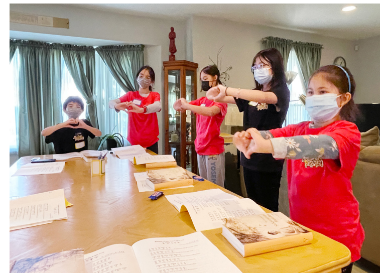
以孩子們熟悉的小星星等曲子結合人間音緣，並加上手語動作，讓小菩薩們學習中文。