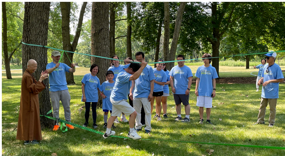
趣味活動 (跳繩、呼拉圈、羽毛球、空中吊繩行走、扯鈴)