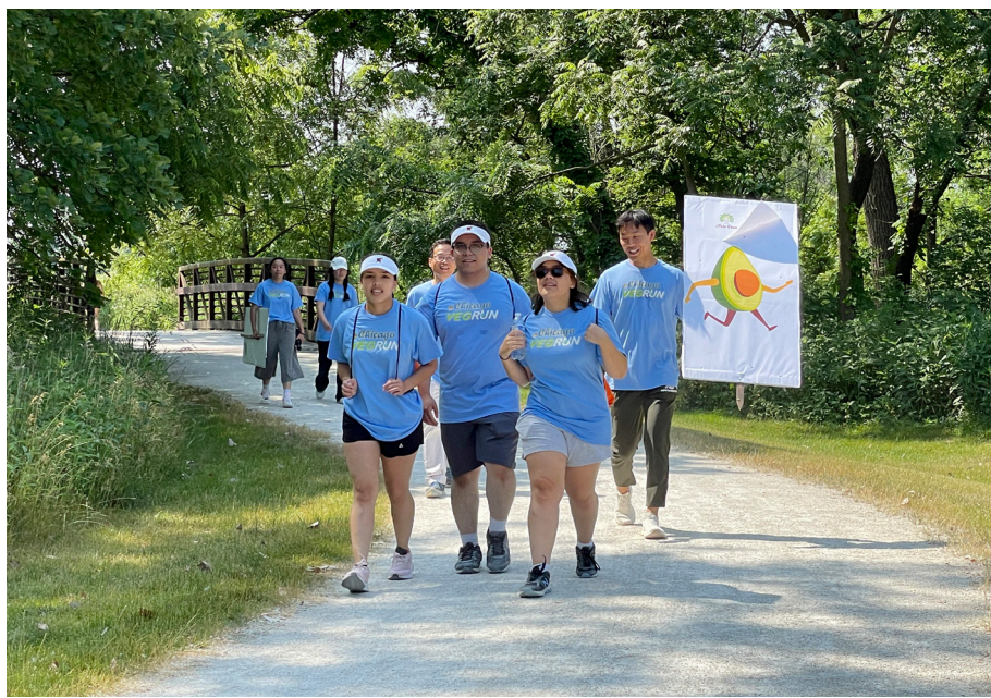
2023年芝加哥 VEGRUN 總動員為地球和社會和諧幸福奮力開跑