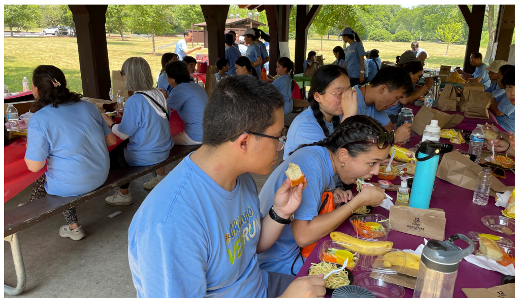
香積菩薩們貼心準備蔬食便當與湯飲供養大家