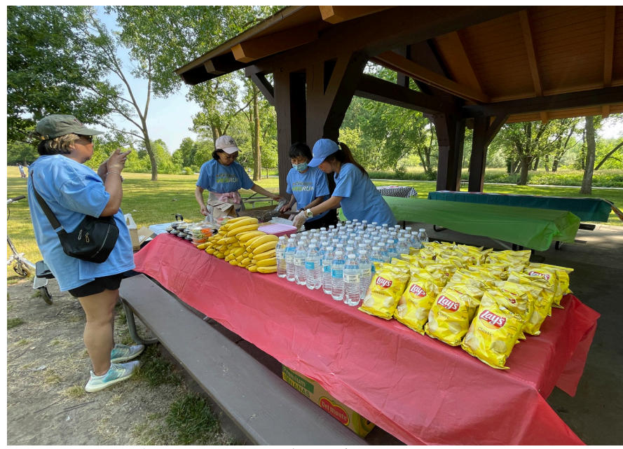
準備了飲水及香蕉等給跑者補充體力