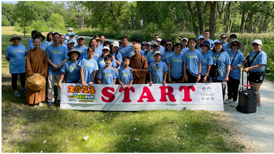
芝加哥佛光會 2023 全球復蔬公益路跑開跑