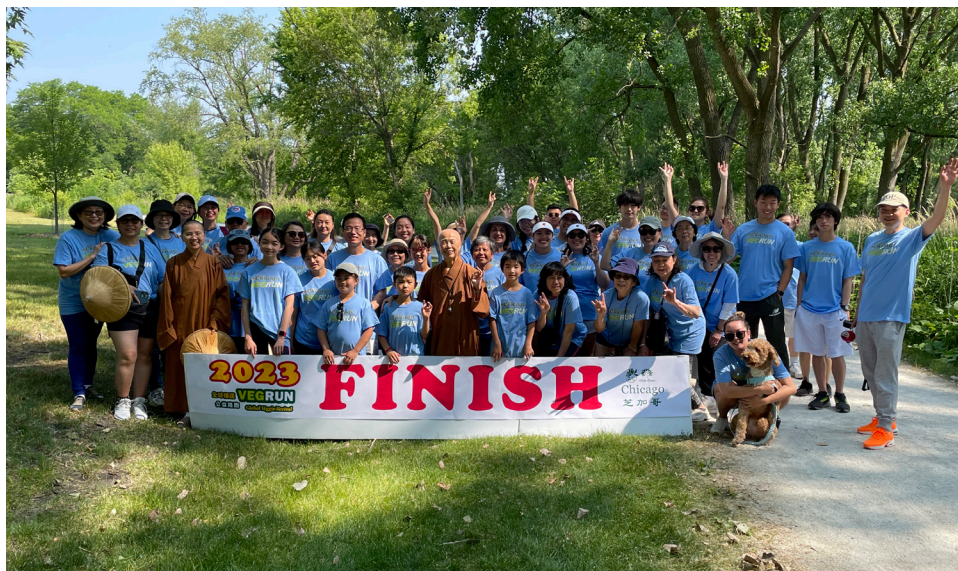
活動圓滿順利完成