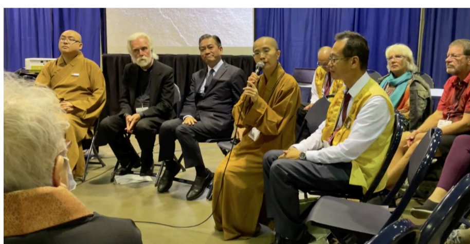
有恆法師分享，在佛光山開山祖師星雲大師所提倡的「同體共生」理念之下，國際佛光會以 Vege Plan-A、T-Earth、Vegrun 等方式，實際行動愛護地球。