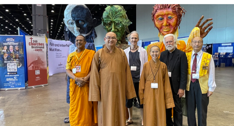
與話劇表演者合影。