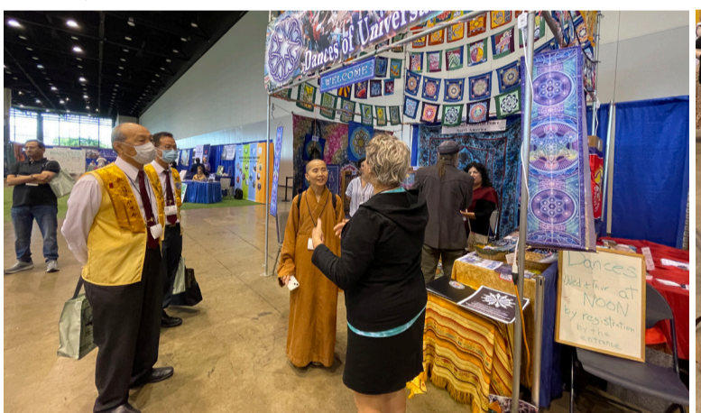
展覽人介紹以和平為主題的舞蹈。