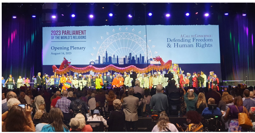
2023年世界宗教議會在芝加哥湖岸中心展覽館開幕。

【本報訊】人間社記者 心功、本通芝加哥報導】議會 (Parliament of Religions) 於14至18日在全北美最大