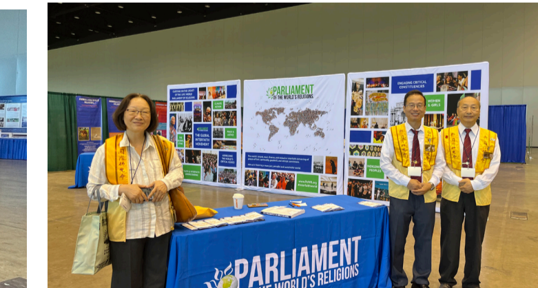
芝加哥佛光幹部參與 2023 年世界宗教議會。