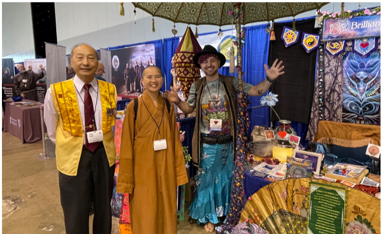
在場有許多新生宗教團體，融合各宗教之所長，提倡快樂與和平。