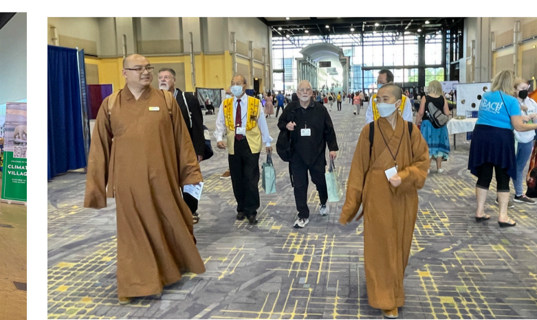
世界宗教議會在芝加哥湖岸中心展覽館舉行。

的芝加哥湖岸中心展覽館 (McCormick Place) 召開。在議會召開之際，吸引來自 80 多個國家地區、超過二百個宗教團體、著名大學宗教學者，上萬人聚集一堂。