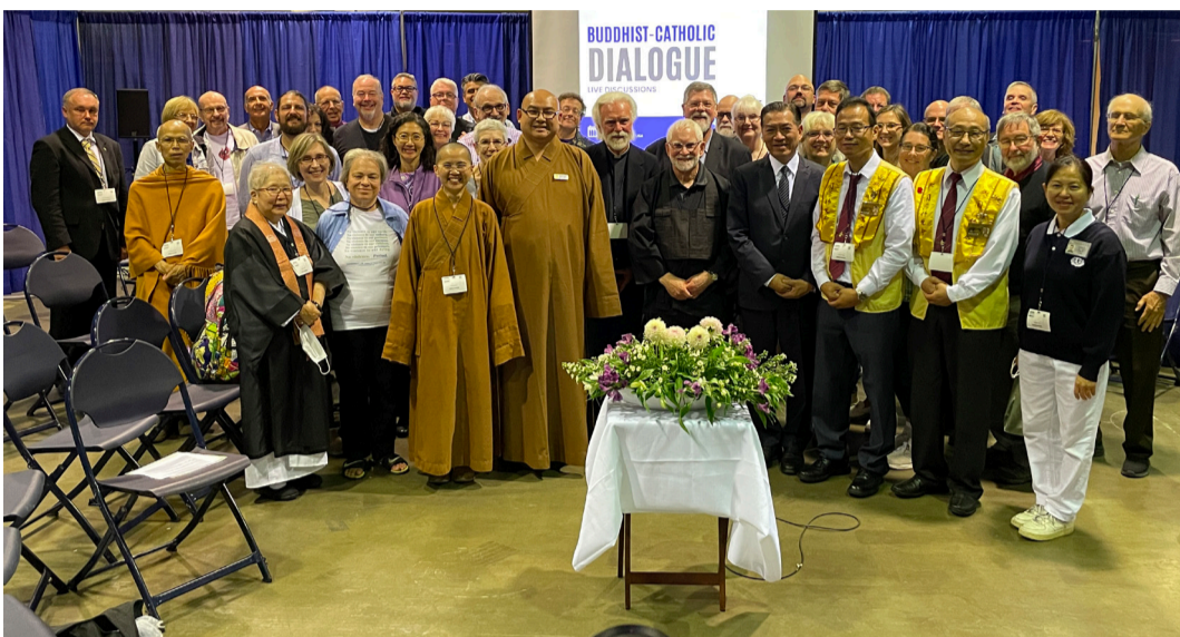
「佛教與天主教氣候變遷論壇」合影。