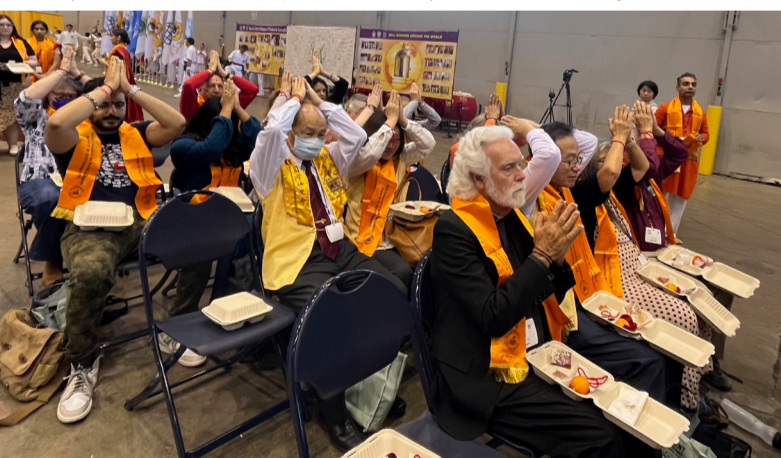
芝加哥佛光幹部們體驗印度教獻供儀式。